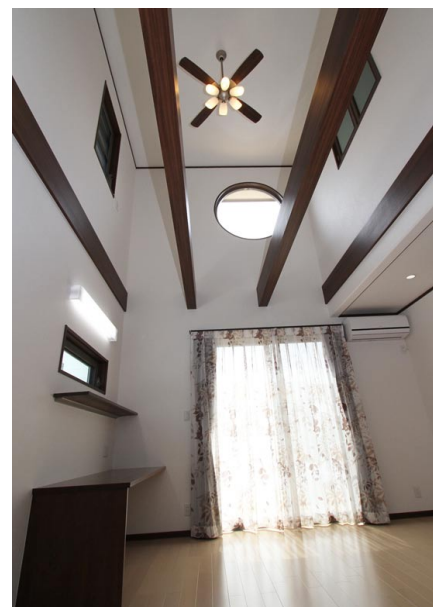
約6帖の広さの吹き抜け。晴れた日には南側の丸窓から陽光が 差し込みます