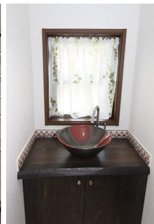
陶磁器のボウルをあしらった玄関横の手 洗い場