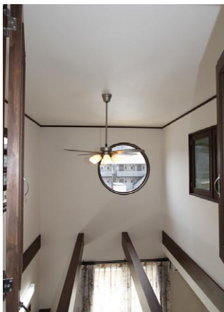
吹き抜けに面する部屋には、窓がつけられ、 とのコミュニケーションもとりやすいです