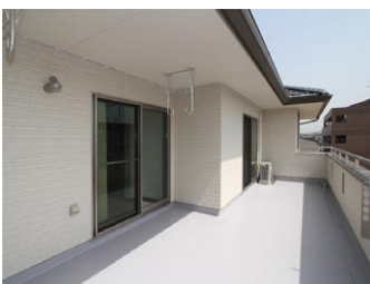
たっぷりの広さのバルコニー。物干しはもちろん 夏には子供さんのプール遊びも可能です