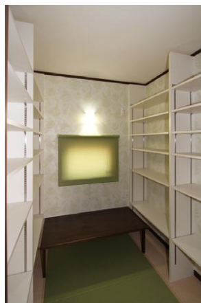
2Fの書斎。テーブル、書棚もビルトインさ れ、ネット環境も整っています