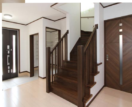
玄関ホールには、木組みの手すりがアンティークな雰囲気を 漂わせる階段が2Fへ伸びています