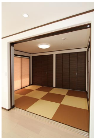
色違いの半畳タタミを使い、モダンな雰囲気 の和室になりました