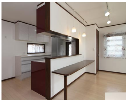
オール電化仕様のキッチン。キッチンカウンター もワイドです