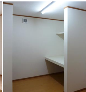
持ち込む家具のサイズに合わせてつくられた2階の納戸