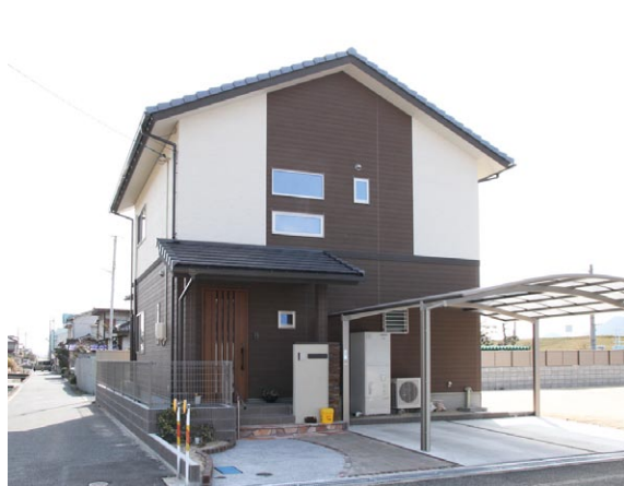
落ち着いた和風モダンのイメージに仕上げられたY様邸