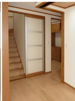
空調効果が向上するように、階段にはスライド式ドアが取り付けられています