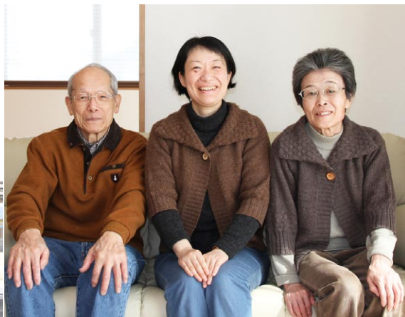
リビングでくつろげるY様ご一家