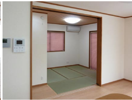
ちょっと横になりたい時など便利なリビングに併設した1階和室