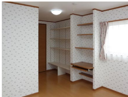
2階の娘さんの部屋。テーブルはパソコン用にスライド式になっています