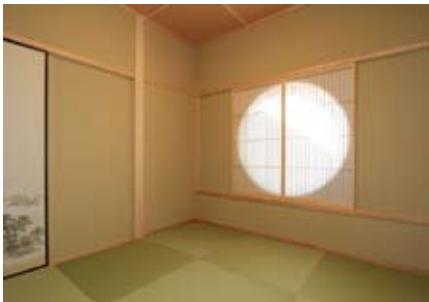
網代組の天井に半帖タミを敷き詰めた和空間。南側の丸窓から障子越しに差し込む光がやわらかい