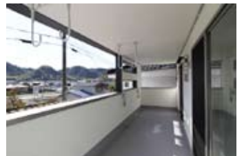
奥行きのあるバルコニー。天井や壁が白で仕上げられており、外壁の黒とのコントラストが面白い