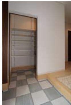
玄関横につくられたシューズクローク兼用の土間収納