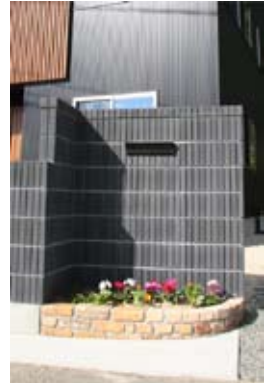
建物の外壁とコーディネートされた外構。ミニ花壇が彩りを添えています