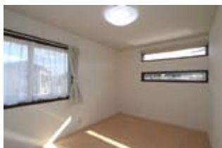
2F子供部屋。横長のスリット窓が印象的です