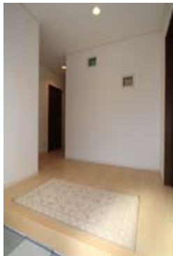
幅、奥行きともにたっぷりの広さを備えた玄関ホール