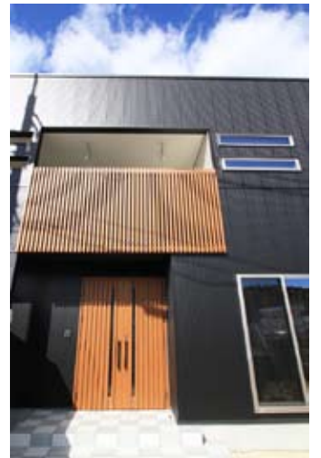
観音開きの玄関ドアで大きな荷物の出し入れもラクに。格子と同じ木質調のカラーが黒い外壁に似合います