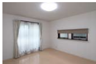
2F寝室。室内は明るい色調でまとめられています