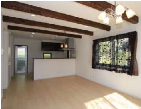
オール電化仕様のキッチンを配したLDK。広々とした空間に焼き杉の木目を浮かせた化粧梁が素敵なアクセントになりました