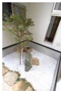
屋外から見た坪庭。もみじの木が植えられています