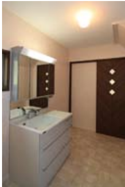
洗濯機置き場を兼ねた洗面室。正面のドアはキッチンへ続きます