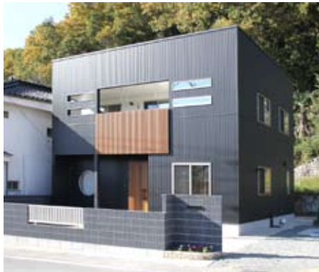
ガルバリウム鋼板を使った黒くて四角い箱をイメージさせる外観。玄関上部の格子模様がおしゃれです