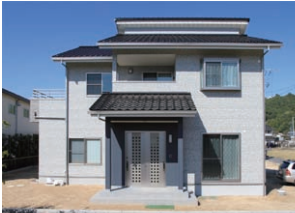
東側正面から眺めたU様邸。どっしりと落ち着きのある外観です。建築内容は「省令準耐火構造」の基準をクリアしており、火災保険料も通常より安くなります