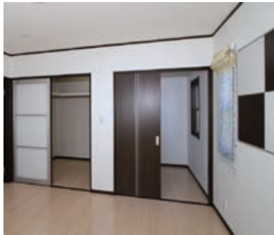
2階の主寝室。右側が書斎スペース、左側がウォークインクローゼット