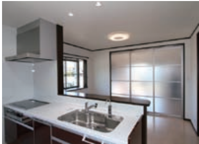
オール電化仕様の対面キッチン。ダイニングとリビングは可動式のハイドアで分割することもできます