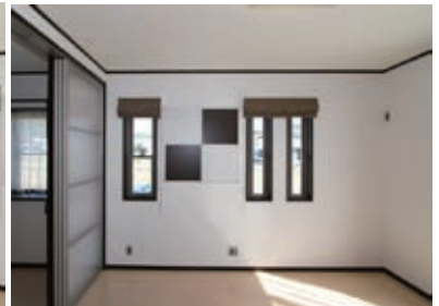
スリット窓を使い開口部を小さくしたのは、こちら側にテレビ台を置かれるための配慮