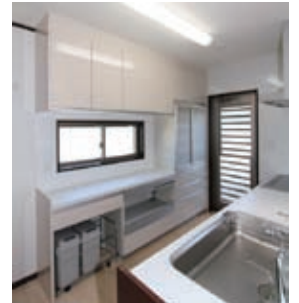
キッチンのバックヤードもたっぷりの広さを確保しました