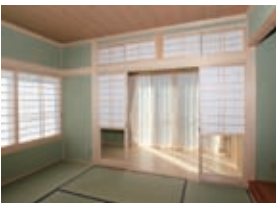
広縁との境には、雪見障子と欄間障子がつきました。障子紙は、通常の4倍の強度を誇るタフトップを使用しています