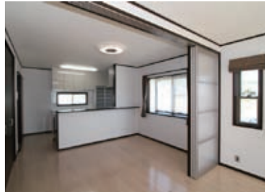
リビング側から眺めたダイニングキッチン