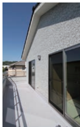
たっぷりの広さを確保したベランダ。水栓もあるので、プール遊びもできます