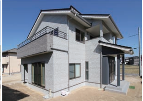
ベランダは2カ所。変化に富んだ外観が、建物のグレードの高さを象徴しています。外壁材もUVカット機能のセラミックコートを使用し、色あせしにくくなりました