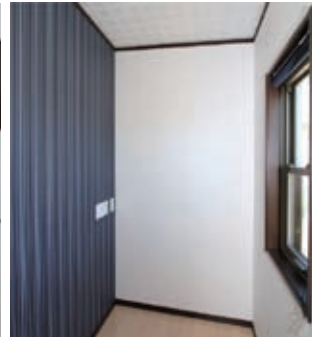
書斎内部。2帖ほどの広さですが、インターネット環境は整っています