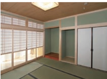
仏間と床の間を配置した本格的な8帖の和室。南側には広縁があり、日なたぼっこにも最適です。